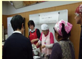
食を通して広げよう健康の輪 ～聴覚障がい者とともに～