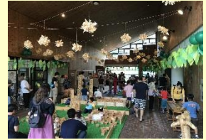
木とあそぶ!まなぶ!ふれあう! ～木くまつりin英彦山～