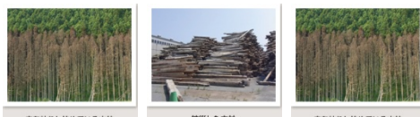
図や写真のタイトル

図や写真のタイトル 課題に関連する図や写真があれば適宜使い、内容の説明が必要であれば適宜説明してください。