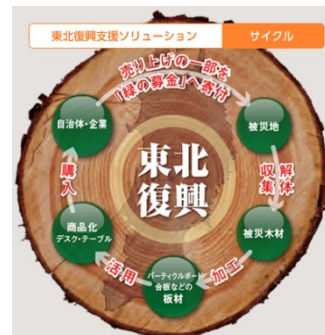
図や写真のタイトル